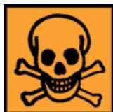
T - Tóxico