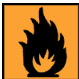
F - Inflamável