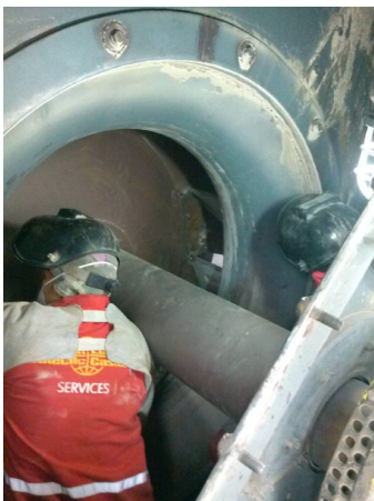
Reparo em Ventiladores e Exaustores, uma especialidade Eutectic Castolin