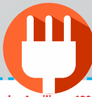
Tomadas Auxiliares 120-240V

A AutoMax 150i possui um motor de 14 HP, capaz de gerar até 150A @ 60% para soldagem com eletrodos revestidos